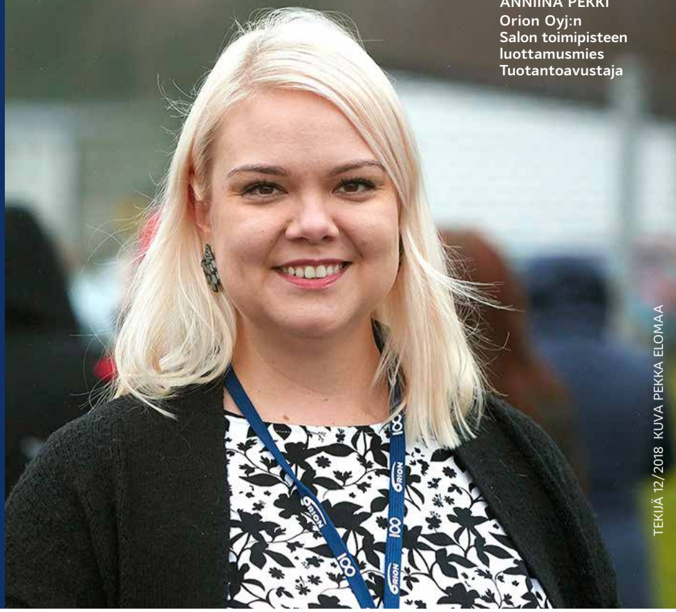
TEKIJÄ 12/2018

Teollisuusliiton jäsenlehti tavoittaa joka kuukausi 210 000 ammattilaista ja heidän perheensä