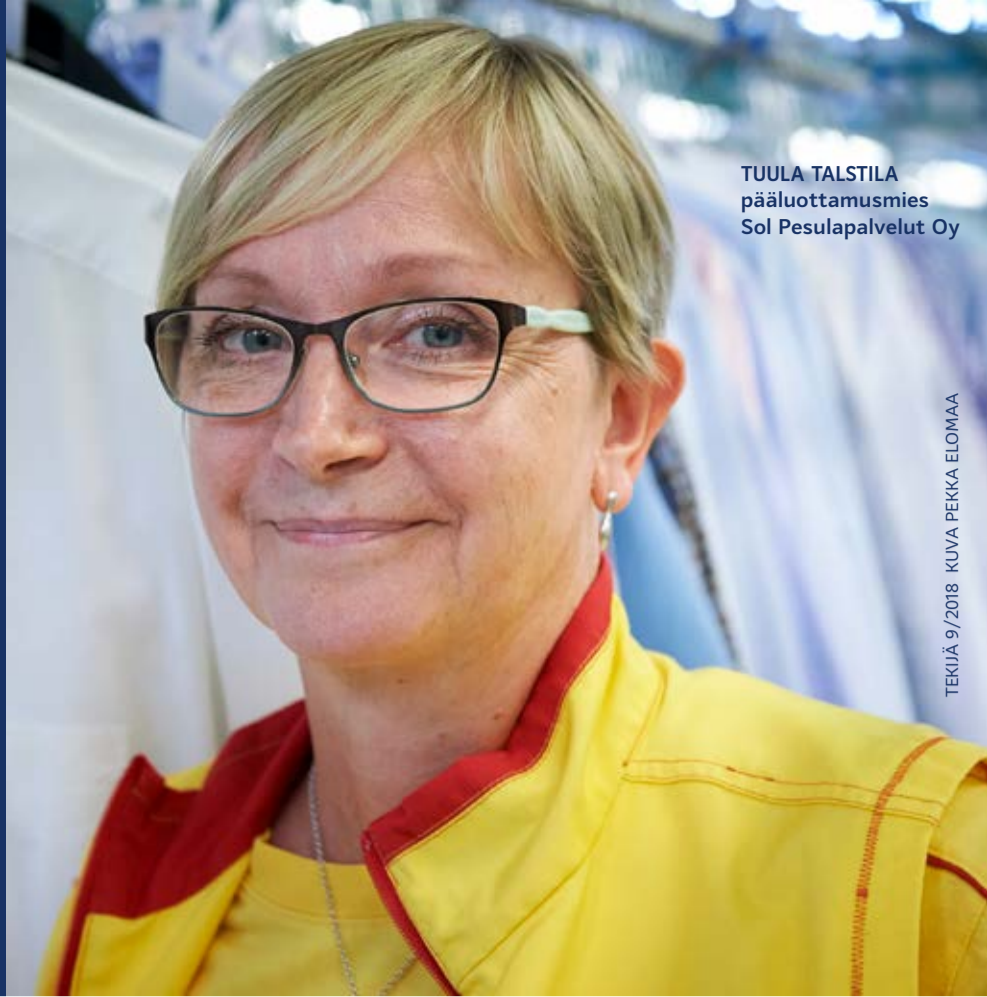
TEKIÄ 9/2018 KUVA PEKKA ELOMÄÄ

Teollisuusliiton jäsenlehti tavoittaa joka kuukausi 220 000 ammattilaista ja heidän perheensä